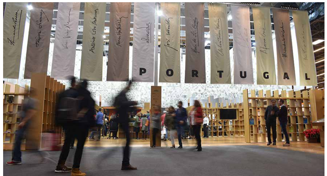
El pabellón de Portugal fue uno de los espacios más visitados durante los nueve días que duró la feria.

Por su parte, la industria editorial contó con una participación importante en la FIL Guadalajara, donde además de acompañar a los organizadores de la Feria en eventos protocolarios, se colaboró estrechamente