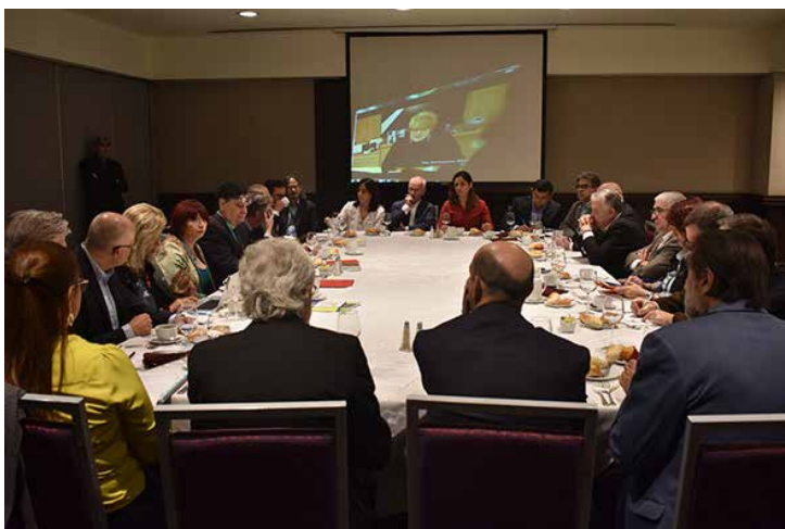
Reunión del Grupo Iberoamericano de Editores.

Un tema a destacar es que este año el estand comercial de la CANIEM tuvo una mayor afluencia de visitantes; cabe mencionar que dicho espacio se ofrece a editores afiliados a la Cámara que no cuentan con un estand propio, por lo que en él tienen la oportunidad de ofrecer sus fondos ya que funciona como un canal de venta y posicionamiento.