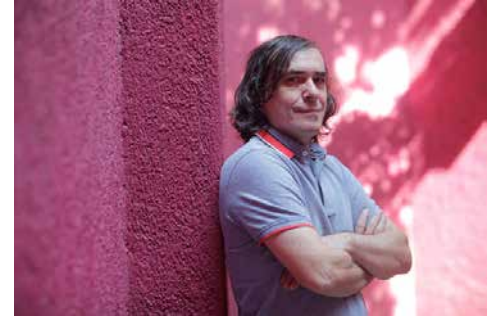
Mircea Cărtărescu.

Antecedido por sus maestros, quienes lo acompañan y están presentes en cada uno de sus textos, expresó que para él existe un ángel, el ángel de es-