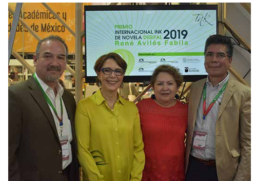
El certamen es convocado por Editorial Ink, la UAM, la UJAT, ASPA y las Fundaciones René Avilés Fabila y Sebastián.

Los autores podrán participar con pseudónimo.