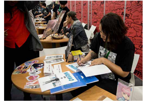
Actividades del Salón del Cómic.

Sol Díaz compartió que le gusta romper los estereotipos femeninos de una manera muy particular: a las mujeres las representa en sus relatos llenas de vello, o en situaciones que no las